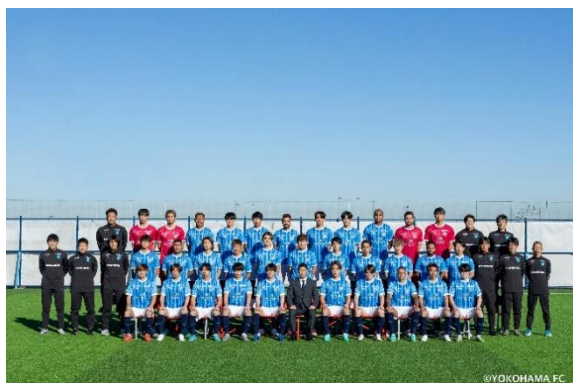
協定を締結した横浜FC