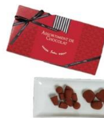
アソーティモン ドウ ショコラ C ¥1,620(税込)

口どけの良さが特徴のチョコレート3種の詰め合わせ。数量限定のパッケージです。※1月24日(水)より販売※限定 800個/B1 ダイヤキッチン