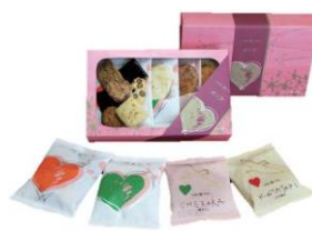
ラブリーハート4種類 4袋入 ¥540(税込)

かわいいハート型お煎餅、おかきの詰め合わせ。甘いものが苦手な方へ。※数量限定 /B1 ダイヤキッチン