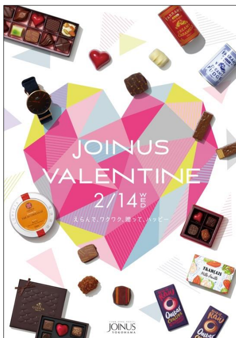
JOINUS VALENTINE メインビジュアル