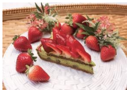
イチゴと抹茶黒豆のタルト ¥832(税込)

イチゴとほろ苦い抹茶を組み合わせたタルト。ザクザクとした食感のクロカンティース、ほっくりとした黒豆、なめらかな抹茶ムースと様々な食感も楽しめます。 ※2月1日(木)より販売/1F