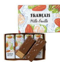
果実をたのしむミルフィユ ジャンドゥーヤ 4個入 ¥540(税込)

アーモンドとヘーゼルナッツのクリームをパイでサンドし、ミルクチョコレートで包んだミルフィユ。 /B1 ダイヤキッチン