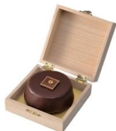
アンテノール・ザッハトルテ(S) ¥1,458(税込)

コク深いチョコレート生地に、アプリコットジャムをのせ、ショコラフォンダンで包んだザッハトルテです。※2月2日(金)より販売 /1F