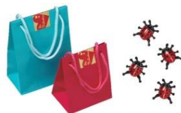
てんとう虫のチョコ 4個入 ¥303(税込) 8個入 ¥864(税込)

ミルクチョコレートの中にはヘーゼルナッツペースト、チョコレートペーストが入っていて、口どけなめらかなプラリネチョコです。/ B1