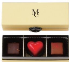
ショコラアソート 3P ¥1,080(税込)

手作りのボンボンショコラは、上品な甘いとほろ苦さ。レモン、紅茶、オレンジの3種のフレーバー。/1F