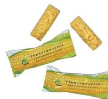
とうもろこしホワイトチョコレート 10個入 ¥410(税込)

ホワイトチョコレートの甘さと、サクサクとしたとうもろこしのクランチ感が相性抜群。 /B1 ダイヤキッチン