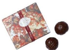
ラムポール 4ヶ入 ¥1,026(税込)

ラム酒を効かせた生地とレーズンをチョコレートの中で発酵させたお菓子です。お酒好きなお父さんへオススメ。 /B1 ダイヤキッチン